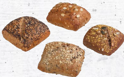
Art. 510356* Better Life Wellness Quartett, 4-fach sortiert

0,452 €/St. • 22,60 €/Kt. 0,407 €/St. • 20,35 €/Kt.